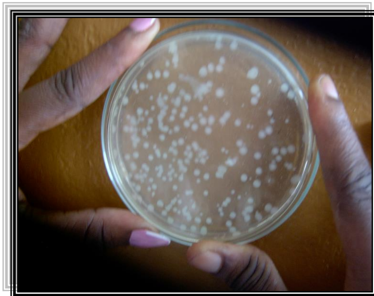
PHOTO No 1 : ISOLEMENT ET DENOMBREMENT DES GERMES AEROBIES MESOPHILES (G.A.M) SUR MILIEU « P.C.A. »